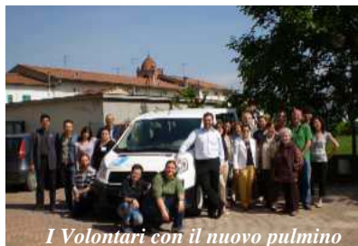
I Volontari con il nuovo pulmino

PER IL CONTRIBUTO DATO AL "POZZO" PER L'ACQUISTO DEL NUOVO PULMINO !